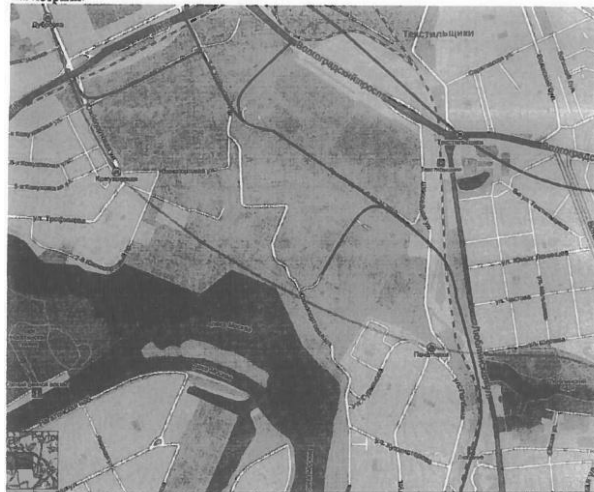
1.1. Альтернативный вариант проекта трассировки магистральной.