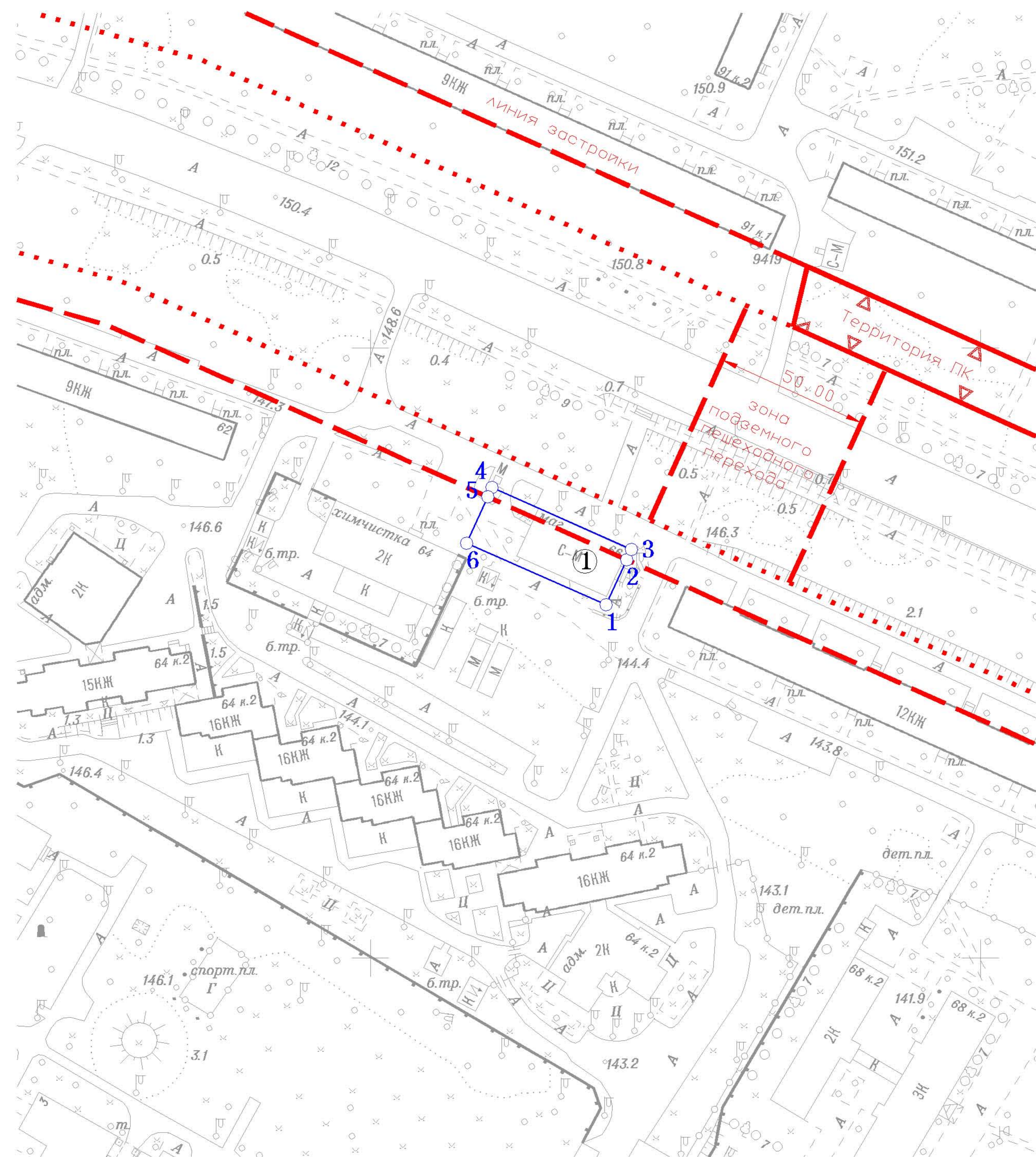
Координаты границ земельного участка