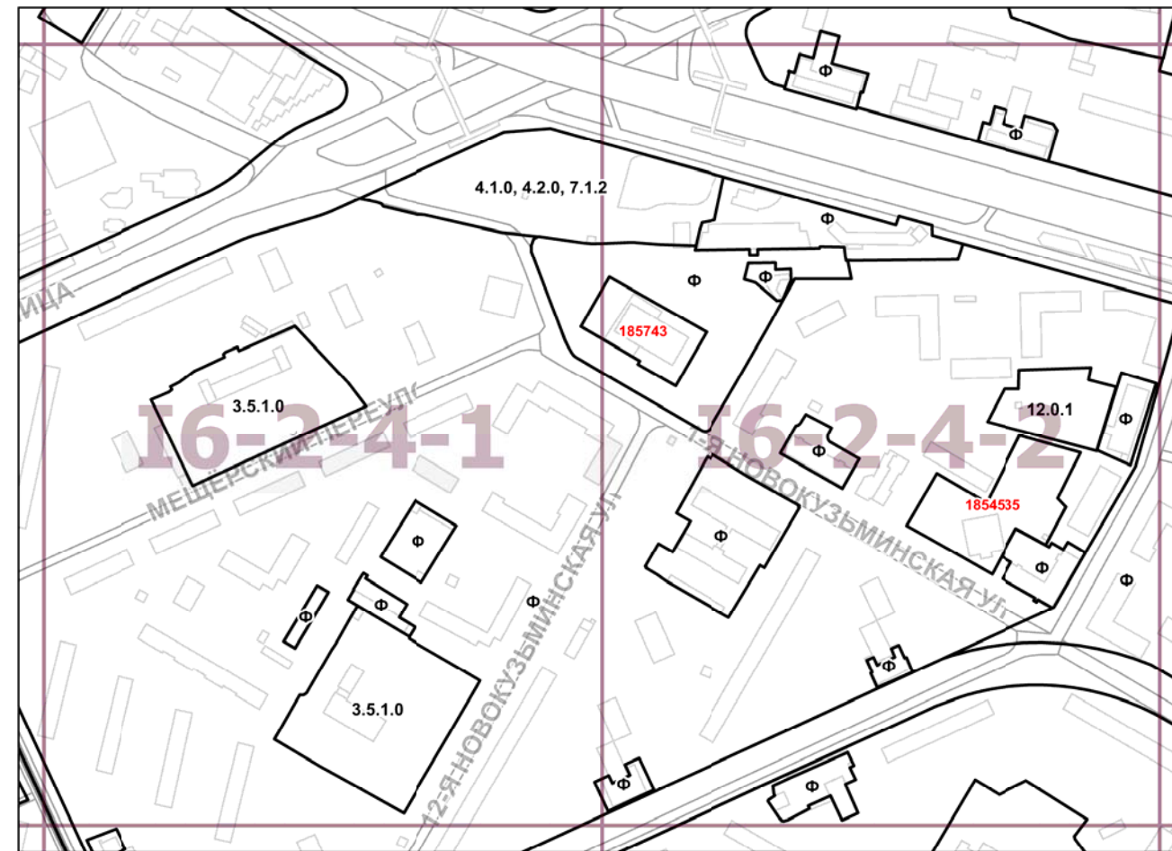
Границы территориальных зон и виды разрешенного использования земельных участков и объектов капитального строительства